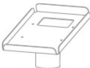
Mocowanie drukarki fiskalnej (na wsporniku ramienia)

Półka drukarki posiada otwory, za pomocą których można na stałe zamocować drukarki Posnet Thermal HD i Posnet Thermal XL2 (zalecane na stanowiskach samoobsługowych). Przepust na przewody w półce umożliwia wprowadzenie okablowania do korpusu MSM możliwie jak najkrótszą trasą. Docisk blokady unieruchamia obrót mocowania drukarki.