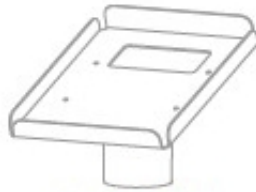
Mocowanie drukarki fiskalnej (na wsporniku ramienia)